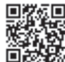
▲みなかみ町観光協会 HP URL2

URL1 https://www.city.utsunomiya.tochigi.jp/citypromotion/1007188.html URL3 https://kankokoryu.com/ URL5 https://www.town.minakami.gunma.jp/