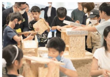
▲ミニイベントの様子