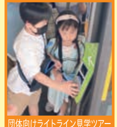
団体向けライトライン見学ツアー ※イメージ