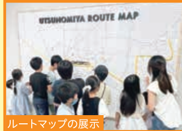
ルートマップの展示

※ワークショップ等の体験内容は、開催日によって異なります。※ライトライン見学ツアーは事前申込制です。