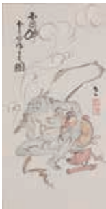
陽成二 《雷神 雲を作る之図》 1924~30年頃

■企画展1 「陽成二展 混ざりあうカタチ」 ▼期間 4月16日まで ▼費用 一般=1,000円、高校・大学生=800円、小・中学生=600円(観覧料)。