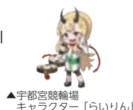
▲宇都宮競輪場 キャラクター「らいりん」

URL2 https://www.tochigisc.jp/ URL4 https://www.utsunomiya-brex.com URL6 https://www.tochigift.com/