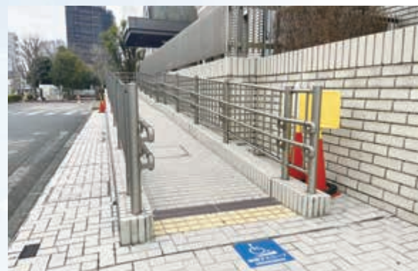
▲本市のバリアフリー推進例 「市役所東玄関スロープ」