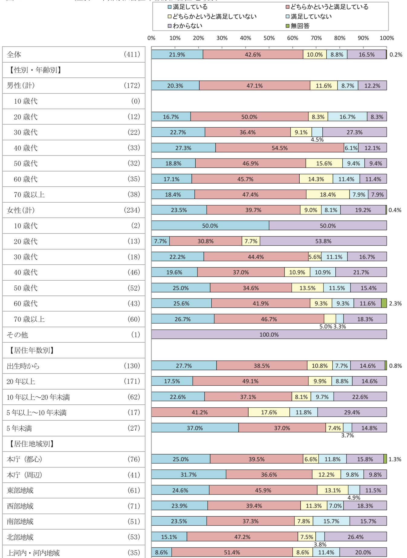
<図Ⅳ－1 1－2>性別・年齢別/居住年数別/居住地域別