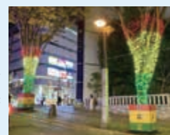
▲商店街(宇都宮中心商店街活性化委員会)が行うイルミネーション事業

▼中心商業地や空き店舗に新規出店する際の費用や、商店街の魅力向上させる取り組みを支援することで、地域内での消費の向上を図ります。