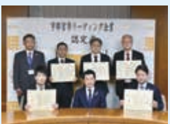
▲宇都宮市リーディング企業認定式(令和3年度)

▼「宇都宮市リーディング企業」を始めとした、市内の中核企業を中心に、関連企業やスタートアップ企業などとの、地域内の企業間ネットワークの構築を促進します。