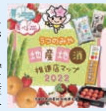
▲うつのみや地産地消推進店マップ

▼「うつのみや地産地消推進店」の取り組みなどにより、安全・安心、新鮮でおいしい宇都宮市産農産品を、買って、食べて応援する環境づくりを推進します。