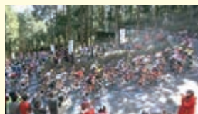
▲2022ジャパンカップサイクルロードレース(森林公園周遊コース)