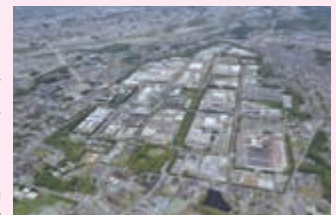
▲内陸型の工業団地では、国内最大級の清原工業団地