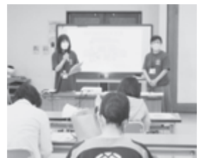
▲協力会員講習会の様子