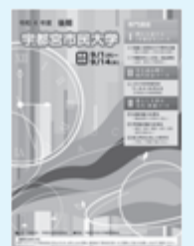
▲令和4年度宇都宮 市民大学(後期) パンフレット