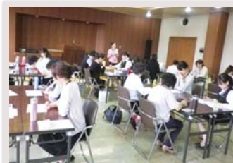
▲宇都宮卸商業団地内で働く女性の交流会「にじいろ会」

卸商業団地内で働く女性の集まりの運営の支援により、第一線で活躍できる女性を増やし、卸商業団地全体の活性化につなげています。