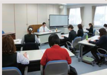
▲キャリア支援に向けた事務研修

各部門での好事例や取組などの情報交換や、仕事を円滑にするためのコミュニケーションの場を設けるとともに、キャリアに対するチャレンジ意欲が高まるよう、目標設定や発表を行っています。