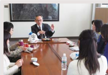
▲職場環境改善に向けた学長とのランチ会

性別に関わらないキャリア形成の支援をはじめ、ダイバーシティの推進に向け、多目的トイレの増設、学内保育園の設置を進めています。