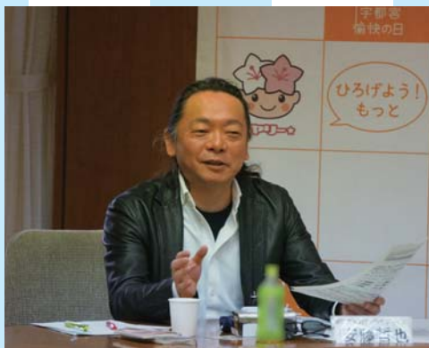
NPO法人ファザーリング・ジャパン ファウンダー／代表理事

働き方を変えるキーパーソンは上司（イクボス）です。今後の日本は、核家族が75%にもなる家族モデルの変化により、育児や介護などの様々な事情で長時間労働で働ける人がごく限られた人のみになります。そのため、誰もが働きやすい職場づくりが必要です。人々のライフスタイルが変わるので、上司の意識も遅くまで残業するという固定化した仕事のやり方や価値観ではなく、部下のワーク・ライフ・バランス（仕事と生活の調和）を考え、その人のキャリアと人生を応援しながら組織の業績も結果を出しつつ、自らも仕事と私生活を楽しめるように変えていけると良いでしょう。イクボスは漢方のようにジワジワと効いてきますので長いスパンで取り組むことが大切です。宇都宮市にもイクボスが増えていくことを望んでいます。