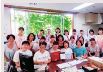
▲10年勤続者表彰記念

情報の共有や事務効率化に向けた事務改善の取組により、長時間労働を削減し、仕事と家庭生活の両立を推進しています。