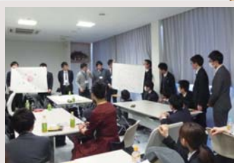
▲女性が働くためのエンカレッジ「上田道場」

社内託児所の完備などにより、育児をしながら働ける環境の整備や、社員一人ひとりの意見を反映できる環境づくりに努めています。