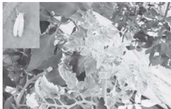
▲トマト黄化葉巻病の葉巻症状とタバココナジラミ

「トマト黄化葉巻病」は、害虫のタバココナジラミが媒介して、トマト農家に大きな被害を与えるトマトの