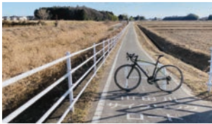
▲山田川サイクリングロード