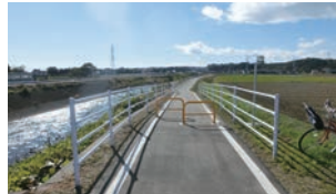
▲田川サイクリングロード