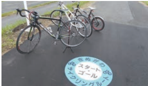
▲鬼怒川サイクリングロード