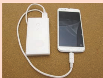
▲モバイルバッテリー