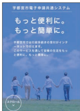
▲宇都宮市電子申請共通システムHPトップ画面