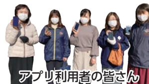
アプリ利用者の皆さん