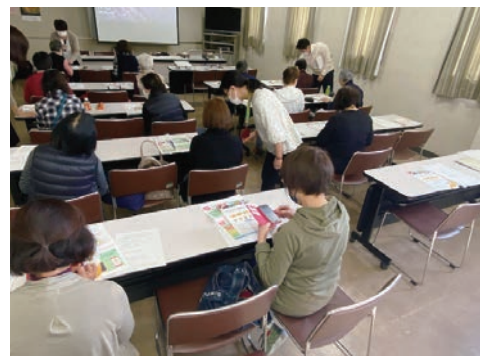
▲スマートフォン教室