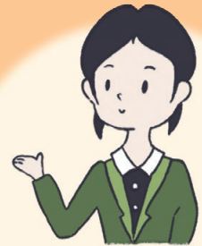
宇都宮市障害者福祉会連合会

今までの通訳者派遣と同様に宇都宮市障害者福祉会連合会へ事前にFAXまたはメールで利用申請する。