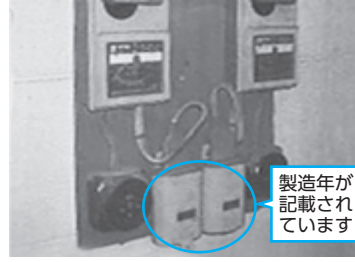
▲低圧進相コンデンサの設置例

低圧進相コンデンサは、モーターで稼働する設備や業務用冷蔵庫などの配電盤に使われている、電力