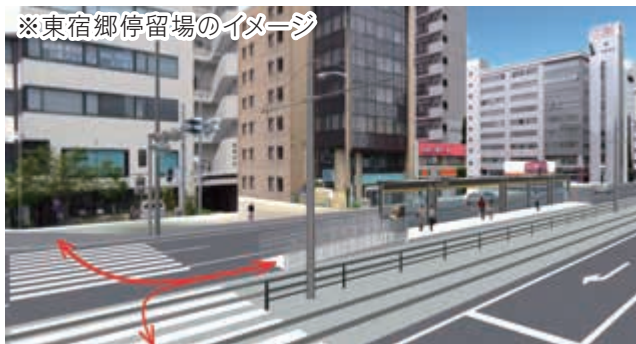
※東宿郷停留場のイメージ

LRTを降りて停留場から歩道へ移動する際にも、横断歩道内の黄色ブロックの内側で待ち、信号が青になってから横断してください。