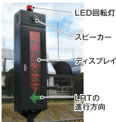
※平石停留場のイメージ

▶グリーンスタジアム前停留場に設置済の接近表示器(撮影のため特別に表示しています)