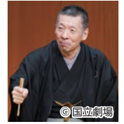
◎国立劇場 柳亭市場