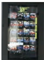
▲オリオンスクエアに設置されたデジタルサイネージ

その結果、ホームページへのアクセス件数から、混雑マップへの高い関心が確認できました。