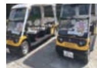
▲グリーンスローモビリティの運行

その結果、人の移動が増える、滞在時間が長くなるなど、さまざまな効果を確認することができました。