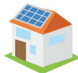
太陽光などの再生可能 エネルギーの利用