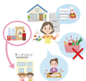
食べ物を大切にする (食品ロスの削減)

先進国である日本が、そして、環境都市を目指す本市が、率先して持続可能な都市に向けた取組を進めていく必要があります、こうした取組がSDGsの達成につながるのです。