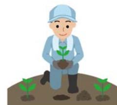
天然林をはじめとした 自然の恵みへの感謝 (自然環境の保全)