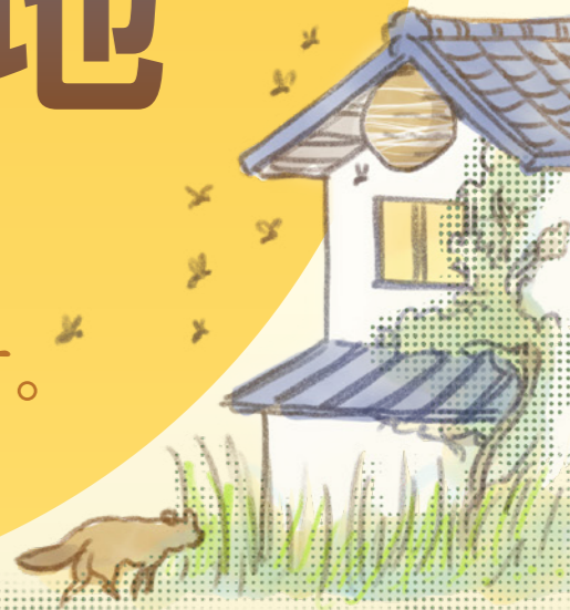
雑草や害虫の発生