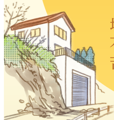
がけ崩れによる 道路の封鎖