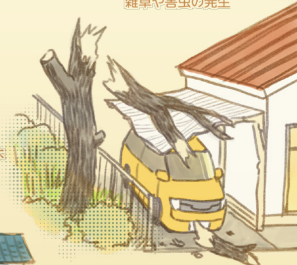
台風や積雪による倒木