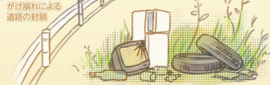
所有地へのゴミ投棄