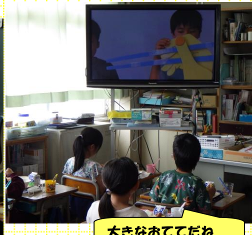
大きなおててだね