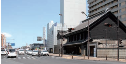
▲博労町交差点付近 (左:昭和29年、右:現在)