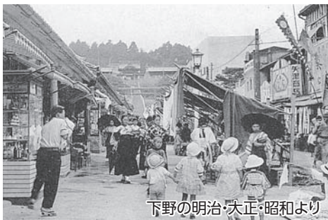
下野の明治・大正・昭和より