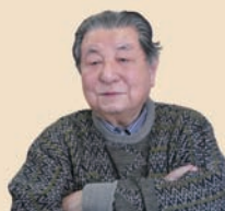
バンバ通り商店街