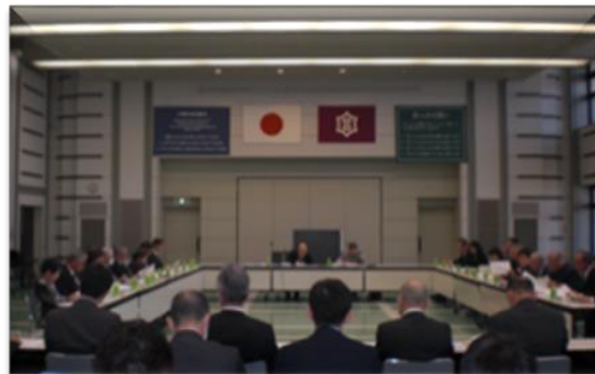
【社会福祉審議会（全体会）の様子】