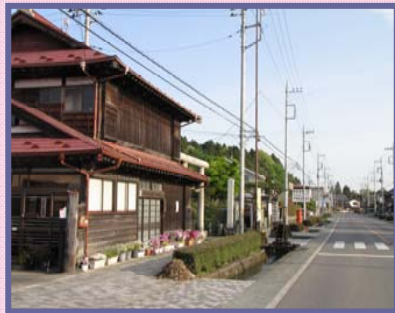
現在の白沢宿の景観