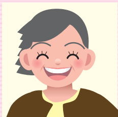
のんちゃん(70代) 孫(11才、7歳)

子育てについて感じていること 子どもから高齢者まで全ての人の人権を尊重し、愛情をもって接すれば、いじめも差別もなくなると思います。