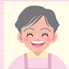
ちいちゃん(60代) 孫(9歳、7歳、6歳、3歳)

作成会議に参加した感想 自分のことは棚にあげ、堂々と子育てを語る自分に呆れつつ、もう少しだけ「おせっかいおばさん」を続けていきます。