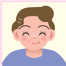
やまちゃん(60代) 孫(17歳から3歳まで6人)

子育てについて感じていること 家族の中において、昔は親が中心にいたように思いますが、今は子どもが中心にいて、親たちが振り回されているように感じます。