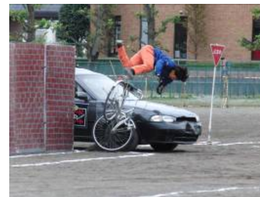
スケアードストレイト方式交通安全教室