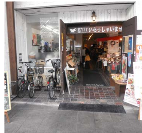
「宮カフェ」駐輪ラック