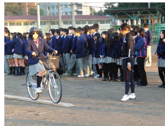
宇都宮ブリッツェン自転車安全利用教室