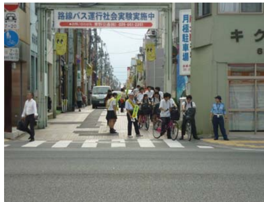
オリオン通りにおける街頭活動