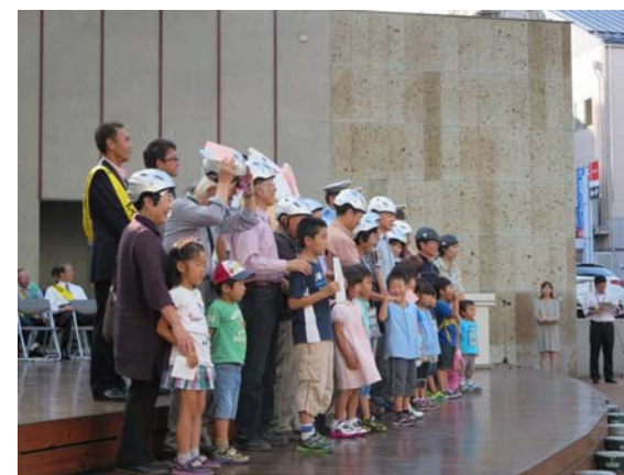
ヘルメット贈呈式