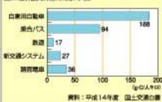
■二酸化炭素排出原単位