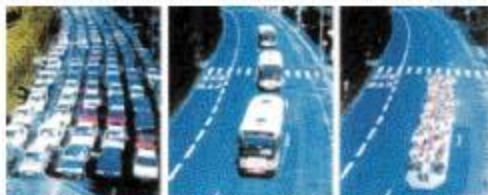
息苦しい(車) 呼吸できる(バス) さわやか!(LRT)

クルマは便利だけど、同じ人数を運ぶ比較してみると…地球温暖化の原因になる二酸化炭素の量がずいぶん違うよ。