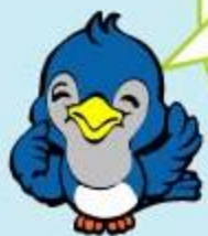
栃木県民の日 マスコット。 オオルリなんだ!

ほく、 ルリちゃん 。 クルマでの生活は とても便利だね。 どこへ行くにも クルマだよ。