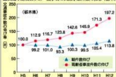
■自動車運転者が第一当事者の交通事故件数の推移（栃木県）