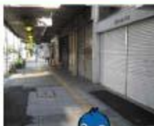
市中心部の空洞化