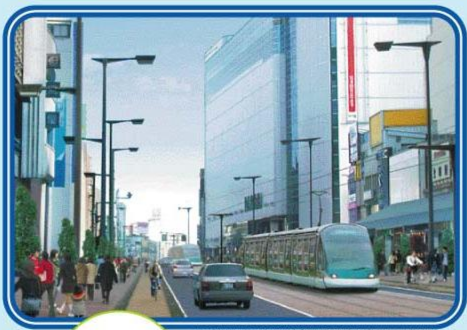
中心市街地(大通り)への導入イメージ「新交通システム導入基本計画策定資料報告書」より

ほく、 ルリちゃん 。 クルマでの生活は とても便利だね。 どこへ行くにも クルマだよ。