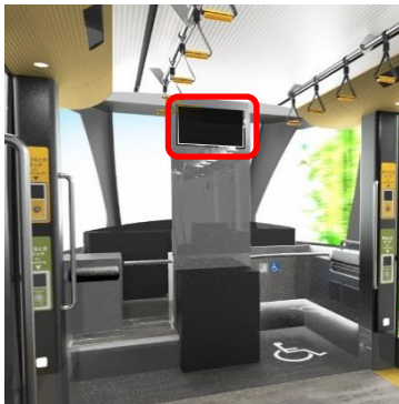
①正面表示器 (幅:約60cm, 高さ:約34cm)