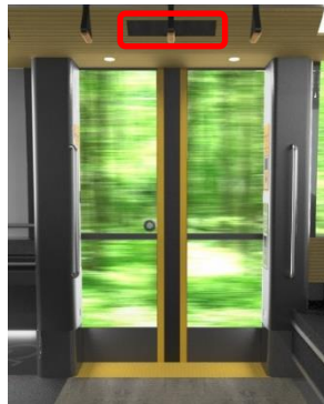
②扉上表示器 (幅:約48cm, 高さ:約9cm)