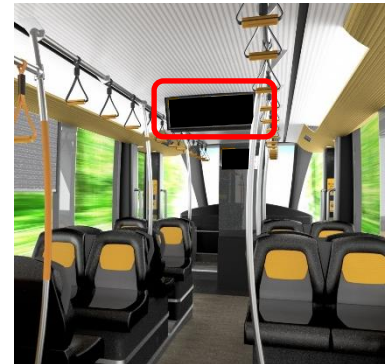
③中吊表示器 (幅:約70cm, 高さ:約20cm)