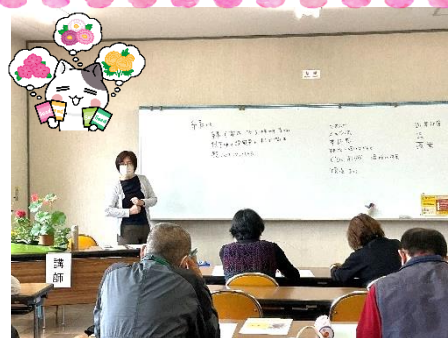
園芸のコツを知ろう (第3回)