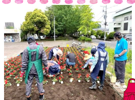
定例活動に参加 (実技部門)