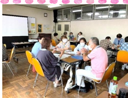
先輩ボランティアと対談 (第6回)