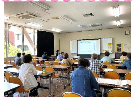
緊張気味のスタート (第1回)