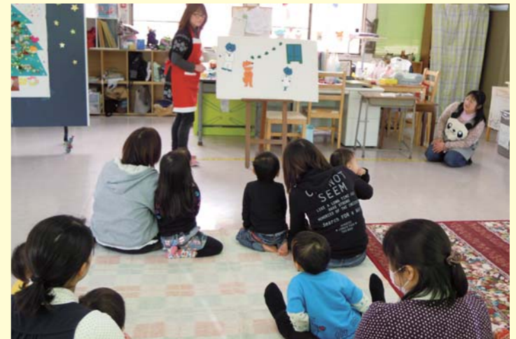
※人材かがやきセンターでは、地域の子育て等に悩む親に寄り添う人材を育てるために、家庭教育サポーター養成講座を開催しています。