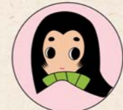
うつのみやの 百人一首マスコットキャラクター 「みやびい」