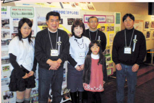
陽南中 おやじの会の皆さん