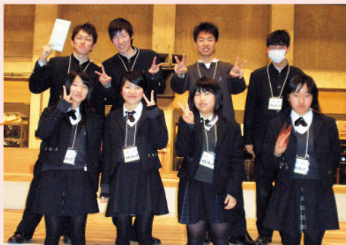
作新学院高等学校 ボランティア部の皆さん