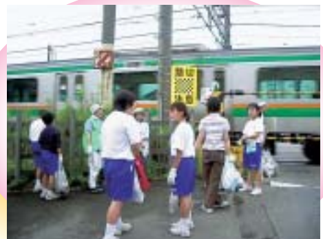
地域の教育力向上 (地区ボランティア活動)