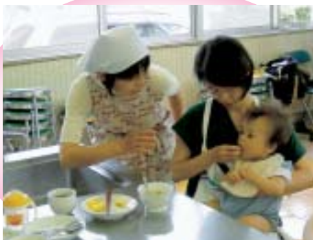
家庭の教育力向上 (親学のススメ)

宇都宮市では、本年度を「うつのみや教育改革セカンドステージ」として、家庭、地域、学校、企業と一体となって人づくりを推進していきます。このパンフレットは、「宮っこ」の学びを支える家庭、地域、学校、企業の役割、教育改革の主な取組などをわかりやすく示したものです。