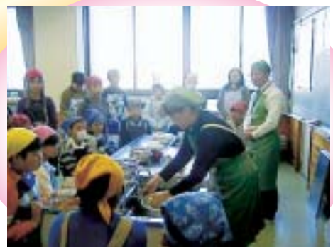
企業の教育力向上 (企業による出前授業)