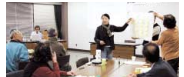
河内地区まちづくり勉強会のワークショップ

地域文化や資源など地域のよさを知り、まちづくりに活かしていく学習が、まちづくり協議会や地区市民センター主催講座など、様々な形でされており、地域力の向上につながっています。