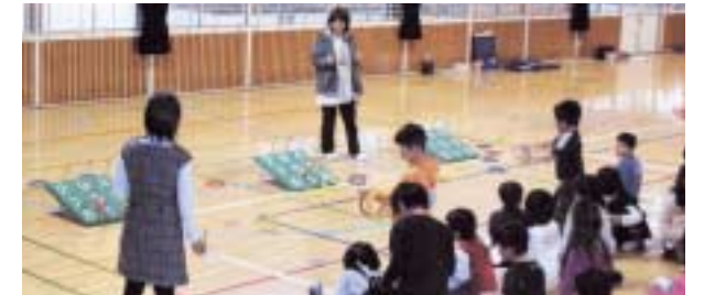
陽光宮っ子ステーションで行われた輪投げ

学校の教室や体育館などを活用して、地域の人たちが協力して放課後や土日に、楽しい活動を行っています。現在、本市では陽南小学校、陽光小学校、晃宝小学校の3校で放課後子ども教室を展開しております。