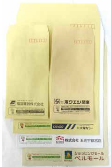
▲寄附していただいた封筒