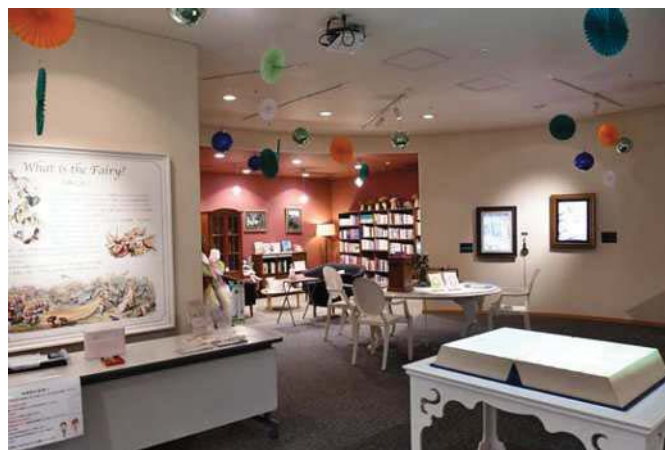
▲妖精ミュージアム Fairy Museum