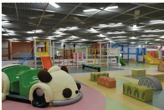
▲ゆうあいひろば Yuai Square