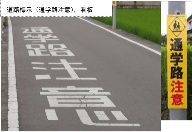
道路標示（通学路注意）、看板