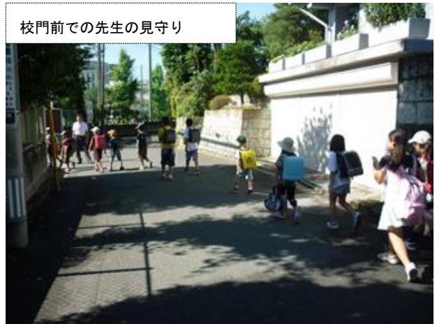
校門前での先生の見守り