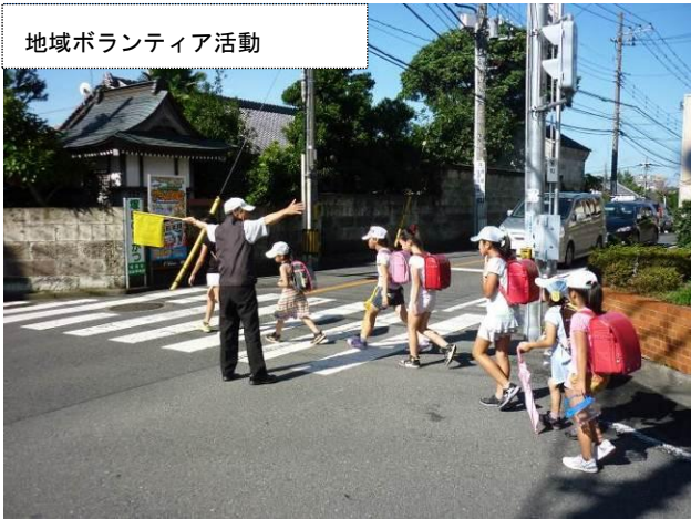
地域ボランティア活動