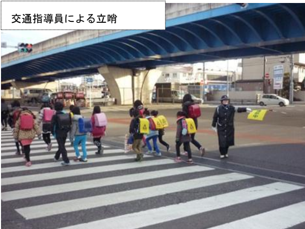
交通指導員による立哨