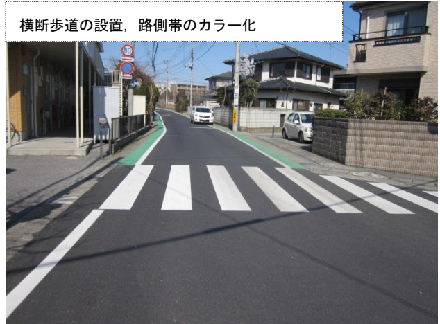
横断歩道の設置、路側帯のカラー化