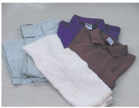
Quần áo như áo sơ mi, các loại vải như khăn

○Rửa sạch, gấp lại sau đó cho vào túi PP trong suốt hoặc bán trong suốt. ○Đồ bị ướt có thể bị nấm mốc trong kho, vì vậy đừng vứt chúng ra ngoài vào những ngày mưa.