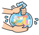
Rác tươi sống