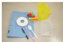
Các loại sản phẩm nhựa