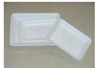
Khay đựng thực phẩm màu trắng, không có hoa văn hay màu, thường dùng đựng thịt, cá, hay thức ăn nấu sẵn.

○Loại bỏ đồ bẩn sau đó cho vào túi PP trong suốt hoặc bán trong suốt.