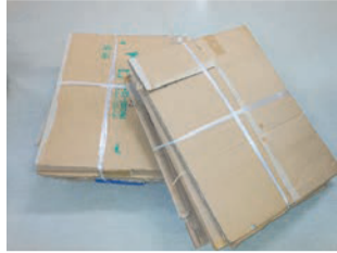
Thùng các tông