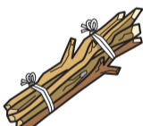
Cành cây v.v..

cho vào túi PP trong suốt hoặc bán trong suốt.