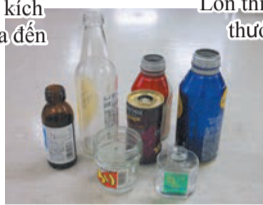
Chai, lon đồ uống, đồ ăn, thuốc uống Chai mỹ phẩm

Chai thì có kích thước tối đa đến 1,8L Lon thì có kích thước tối đa 20 cm