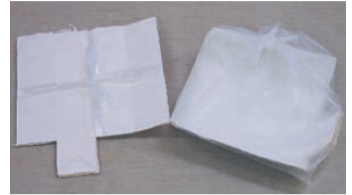
Hộp giấy mà bên trong màu trắng như hộp sữa hay hộp nước trái cây

○Rửa qua, cắt ra rồi để khô, sau đó cho vào túi giấy buộc lại theo hình chữ thập, hoặc cho vào túi PP trong suốt hoặc bán trong suốt.