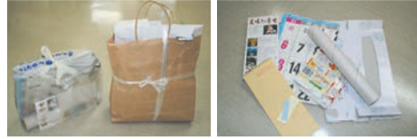
Các loại tạp chí, sách Các loại giấy như phong bì hay hộp giấy

○Tạp chí thì hãy buộc theo chữ thập bằng dây. Những loại giấy khác, bỏ các vật lạ như màng phim, sau đó cho vào túi giấy buộc lại theo hình chữ thập, hoặc cho vào túi PP trong suốt hoặc bán trong suốt.