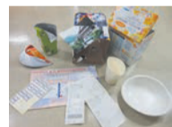
Giấy không tái chế được (giấy không thấm nước, giấy in nhiệt, vv)