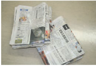
Báo (Bao gồm tờ rơi gấp vào)